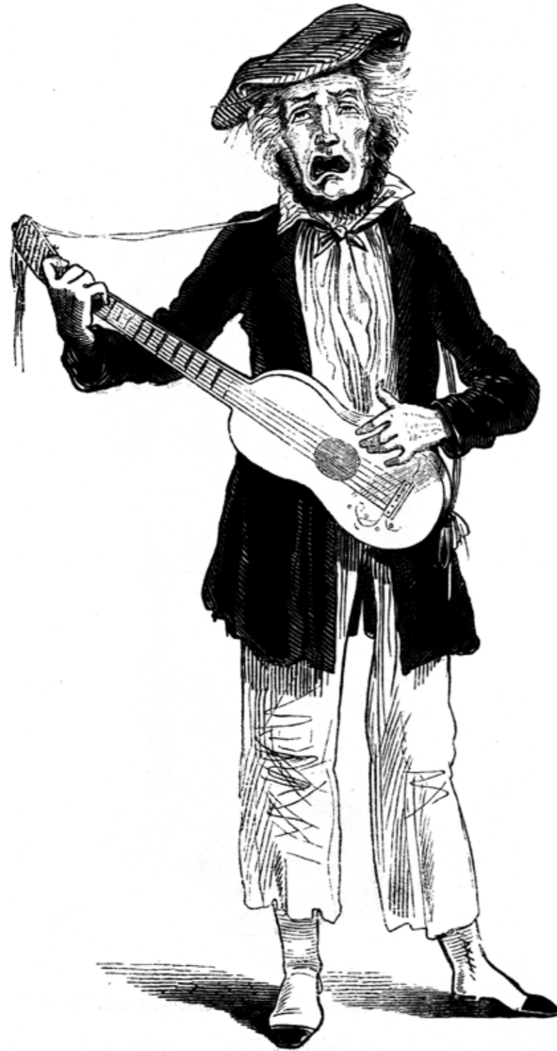
NEULICH IM TURNSAAL